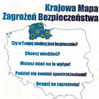
Mapa nr 2: Krajowa Mapa Zagrożeń Bezpieczeństwa.

Od lipca 2016 r. w Polsce funkcjonuje Krajowa Mapa Zagrożeń Bezpieczeństwa będąca narzędziem, które pozwala Policji przyspieszyć reakcję na pojawiające się lokalnie zagrożenia, a także zapewnić dopływ informacji o takich zagrożeniach, głównie od mieszkańców lokalnych społeczności. Pozwala ono także na obiektywne zdiagnozowanie stanu bezpieczeństwa na podległym terenie służbowym.