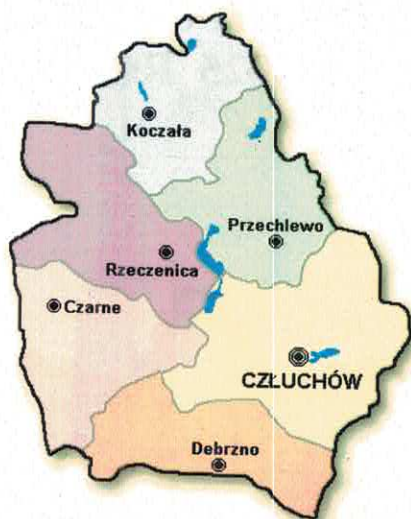
Mapa nr 1: Obszar powiatu człuchowskiego.

Rejon odpowiedzialności (powiat człuchowski) położony jest w południowo-zachodniej części województwa pomorskiego. Od strony północnej powiat człuchowski graniczy z powiatem bytowskim, od strony wschodniej z powiatem chojnickim, które są częścią województwa pomorskiego. Od strony zachodniej graniczy z powiatem szczecińskim, który jest częścią województwa zachodniopomorskiego. Od strony południowo-wschodniej z powiatem sępoleńskim stanowiącym część województwa kujawsko-pomorskiego, od strony południowo-zachodniej z powiatem złotowskim stanowiącym część województwa wielkopolskiego.